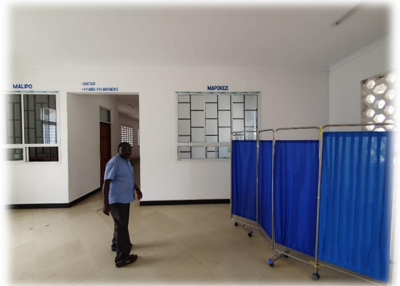
Der Pfarrer zeigt das kleine Krankenhaus, das vor allem für Geburten und die Gesundheitsvorsorge von Kindern vorgesehen ist.

versucht, eine Kirche zu bauen und bisher noch nicht einmal die Hälfte geschafft hat. Die nächste Pfarrei mit einem Priester liegt etwa