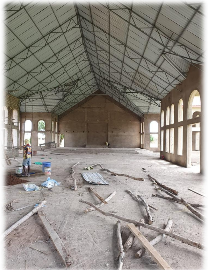
Hier entsteht allmählich die Pfarrkirche von Ngomamutimba, zu der 6 Außenstationen gehören.

Gerade dieser Gedanke hat mich in den vergangenen Wochen besonders bewegt. Viele von Ihnen wissen, dass ich Ende April und Anfang Mai in Kenia und Tansania unterwegs war. Gemeinsam mit einem befreundeten Ordensmann durfte ich Gemeinden seines Ordens in beiden Ländern besuchen. Ich kenne die Kirche meiner Heimat Indien, habe während meines kurzen Aufenthaltes auch die Kirche in Italien erlebt und bin seit 2009 mit der Kirche in Deutschland verbunden.